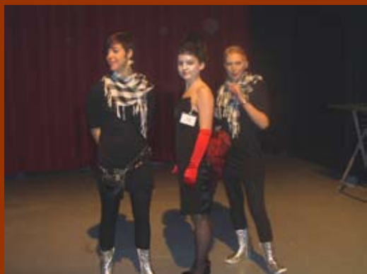
Young Talents van Hessel Hairfashion maken indruk bij Trendvision Awards in Utrecht.